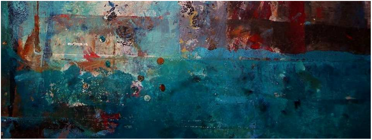
(Emilio Merlina, Temporaneo panorama )