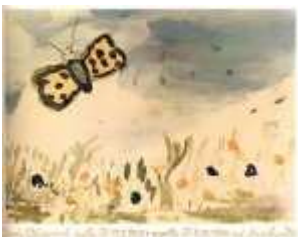
(La Biblioteca di RebStein, Vol. XXX)