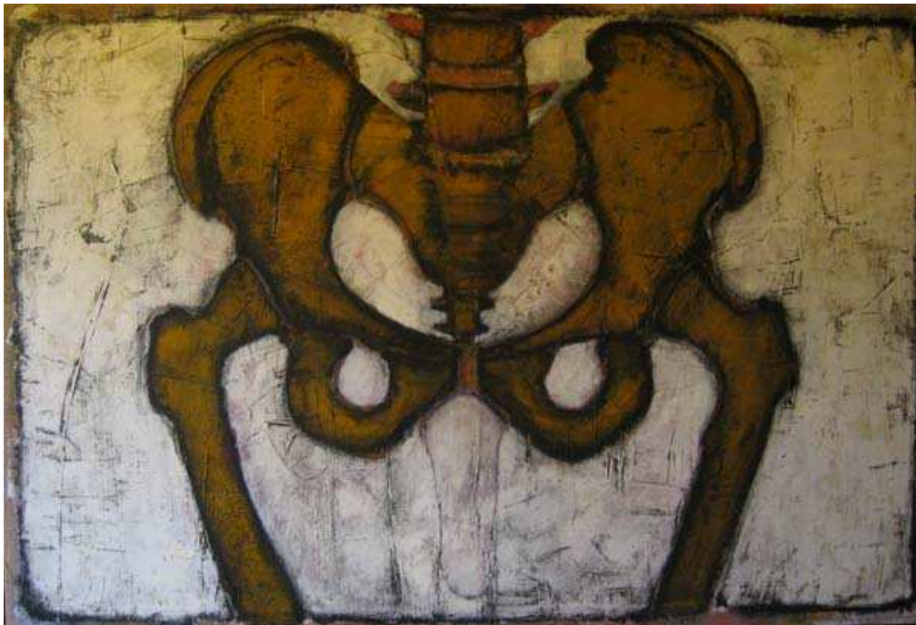
(Fabio Mingarelli, Natura morta )