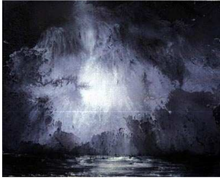
(Miquel Barcelò, Plenilunio , 2003)