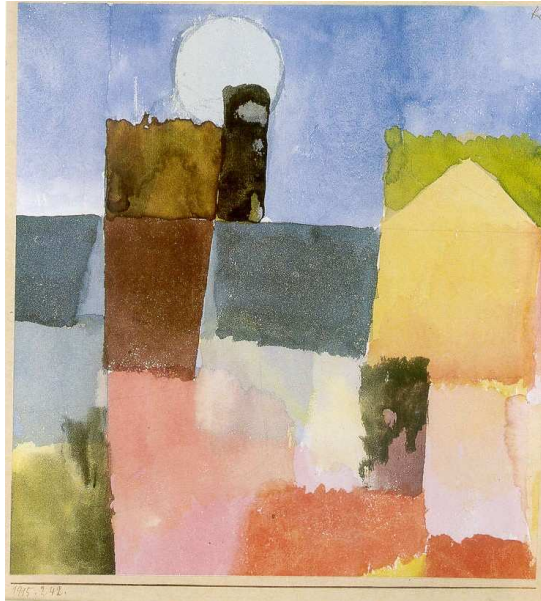
(Paul Klee, Il sorgere della luna , 1915)