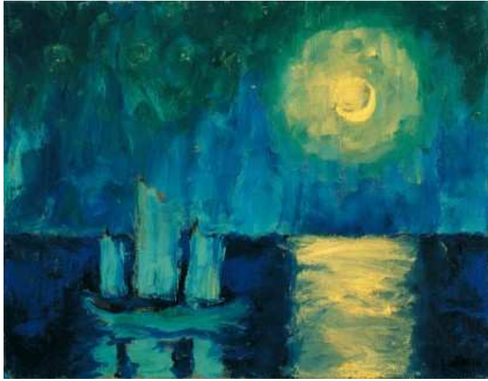
(Emil Nolde, Moonlit Night , 1914)