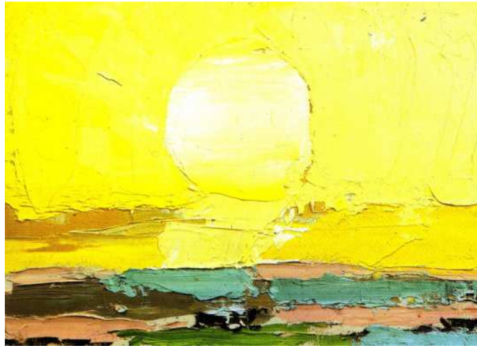
(Nicolas De Staël, Le soleil , 1952)