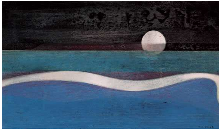
( Max Ernst , Humboldt Current , 1951/52)