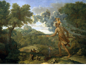
(Nicolas Poussin, Orione cieco in cerca del sole , 1658)